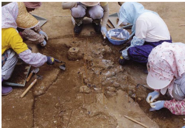
旧白滝5遺跡 調査状況