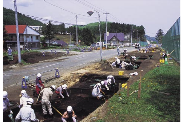
むかわ町穂別D遺跡

遺跡は、鶴川の支流である穂別川の右岸の段丘上、むかわ町穂別の市街地にあります。鶴川は日高山脈北部のトマム岳に源を発し、占冠村の盆地や赤岩の峡谷を流下し太平洋に注いでいる一級河川であり、むかわ町内で知られている約百カ所の遺跡の多くは、その流域に分布しています。穂別地区には縄文時代早期からアイヌ文化期までの遺構や遺物が確認されており、昭和30～40年代には穂別高校郷土研究部による調査が行われています。今回の調査は道道の改良工事に伴って行われているもので、8月末までに4,240㎡を調査する予定です。6月末現在で、遺構は、柱穴11カ所、焼土6カ所、遺物は、鉄鍋片、鎌、擦文土器、縄文時代中期の土器片、黒曜石製の石器、緑色泥岩製の石斧とその製作剥片や素材が出土しています。