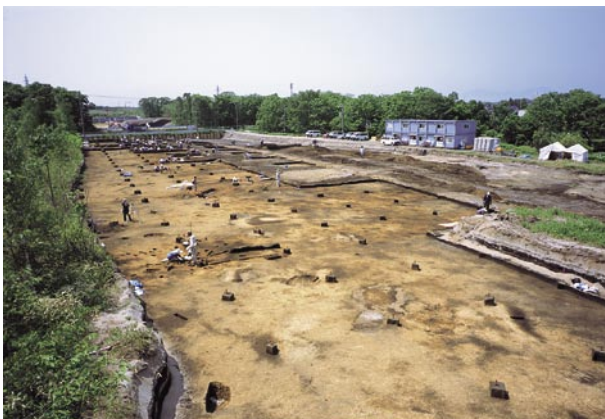
千歳市祝梅川小野遺跡

このうち、縄文時代前期の住居跡周辺からは、ほぼ同時期の土坑が数基みつかっています。これらの土坑からは掌大にまとめられた粘土のかたまりが多数出土しています。また、縄文時代後期の住居跡には、土器片で囲った炉がみられます。