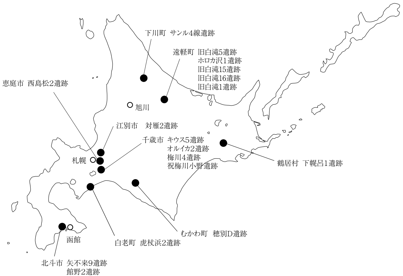
遺跡位置図 (現地調査遺跡のみ表示)