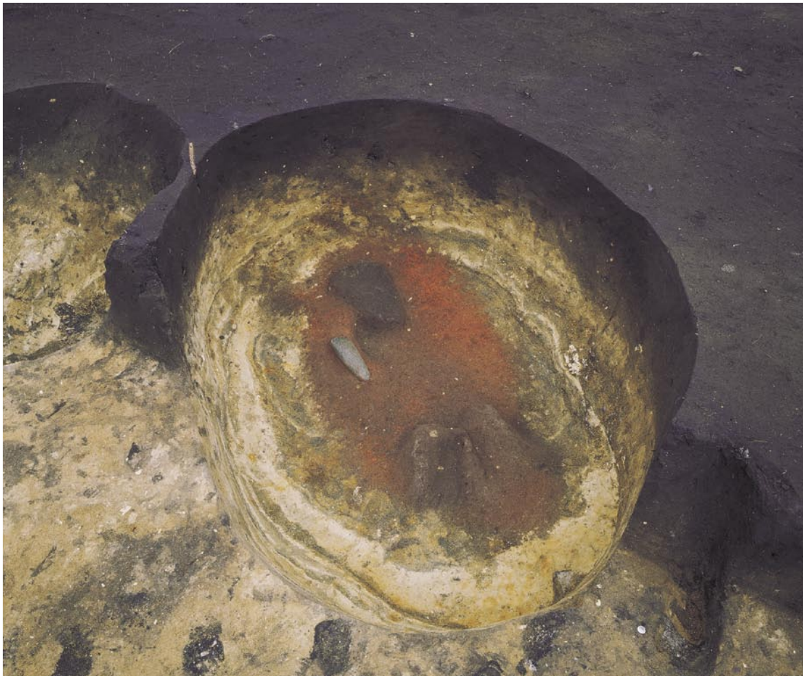
恵庭市西島松2遺跡 1275号土坑（縄文時代晩期）

「テエタ」はアイヌ語で“昔”を意味します。北の大地で繰り広げられた昔の人々の文化や環境を、現在と未来の人々に伝えるのが私たちの仕事です。昔のこと、古いことを広く知ってほしいという願いを込めて「テエタ」をこの冊子のタイトルにしました。