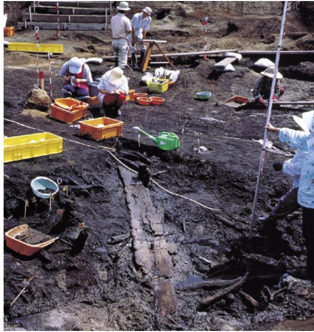
千歳市美々8遺跡舷側板出土状況