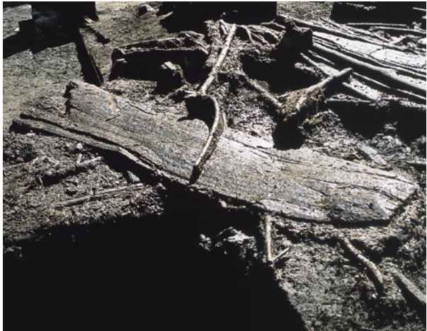
千歳市ユカンボシC15遺跡舟敷出土状況