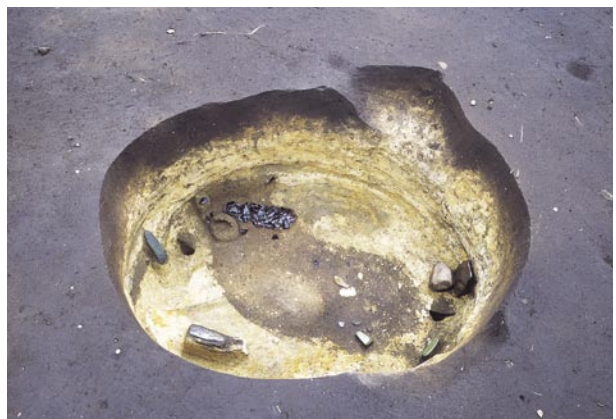
恵庭市西島松2遺跡 1196号土坑

遺跡は、JR 恵み野駅から西に約700m、柏木川とキトウシュメンナイ川に挟まれた標高約28mの河岸段丘上に立地します。縄文時代早期からアイヌ文化期までの遺構が見つかっており、これまで発見された土坑の数は1300基を超えます。今年度は、8世紀代の擦文時代の住居跡が10軒見つかったほか、縄文時代晩期後葉の墓などが検出されています。写真は1196号土坑(長径約160cm、短径130cm)で、縄文時代晩期後葉の墓です。被葬者は南頭位で、左脇からは黒曜石の剥片約150点が袋に入れられたかのようにまとめて出土し、足元には頁岩製のナイフ、北側壁際にはやや大きめの礫が2点のほか石斧などがありました。また、墓の長軸両端には墓標の跡と見られる柱穴が見つかっています。