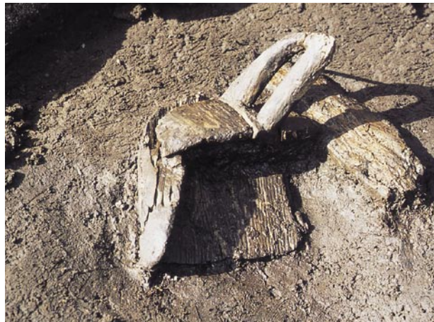
千歳市美々8遺跡あかくみ出土状況