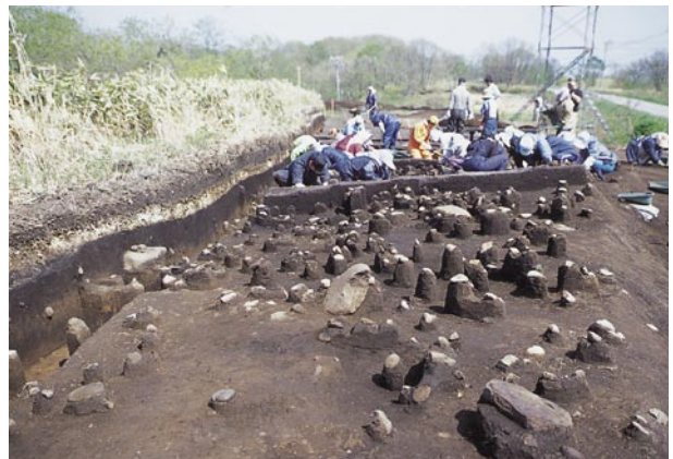
白老町虎杖浜2遺跡・盛土遺構調査状況

遺跡は、北斗市街地から約3.5kmの函館湾を一望する標高49～58mの海岸段丘上に位置しています。時期は、主に縄文時代中～後期初頭で、遺構は、堅穴住居跡16軒、土壇54基、焼土37カ所などがあり(6月末現在)、住居跡の様子から複数時期の集落があったとみられます。土坑は墓やフラスコ状のものがああります。遺物は、非常に多く、土器は、円筒土器上層式や見晴町式、榎林式、大安在B式、煉瓦台式、大津式、天祐寺式、十腰内式系など、石器は、石槍、石鏃、石錘、つまみ付きナイフ、スクレイパー、石斧、たたき石、すり石、砥石、石皿・台石など、土製品は土偶がああります。なお、頁岩製の細石刃1点も出土しています。