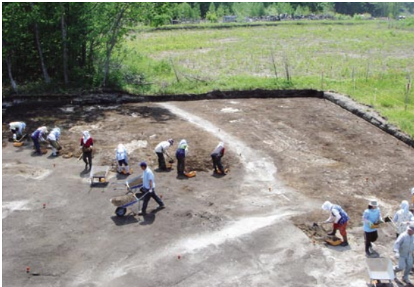
千歳市オリカ2遺跡

6月末現在で、アイヌ文化期の道跡、縄文時代の土坑3基と焼土13ヵ所を検出しました。遺物は、縄文時代早期後半、中期、晩期の土器や石鏃、石錐、つまみ付きナイフ、スクレイパー、石斧、石核、フレイクなど合わせて約6,500点が出土しています。礫や礫片は非常に少なく、フレイクも少ない割には製品の出土量が多いのが特徴です。なお、縄文時代晩期の土器が遺物点数の95%以上を占めています。