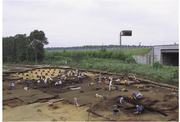
千歳市キウス5遺跡

今年度は台地部を調査しており、主に縄文時代中期の竪穴住居跡、土坑、焼土などの遺構が見つかっています。縄文時代中期の竪穴住居跡は互いに近接しており、規模が4～5m程度のやや小型のものや8mを越える大型のものがみつかっています。焼土は列状に並ぶ分布が特徴的です。遺物は縄文時代の土器・石器や擦文時代の土器、後期旧石器時代の石器などが出土しています。縄文時代の土器は中期・晩期のものが主で、石器は磨製石斧や砥石が多く出土しています。