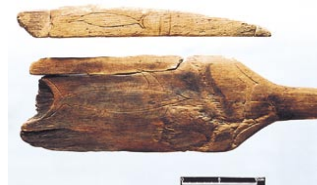
メカジキの線刻がある櫂