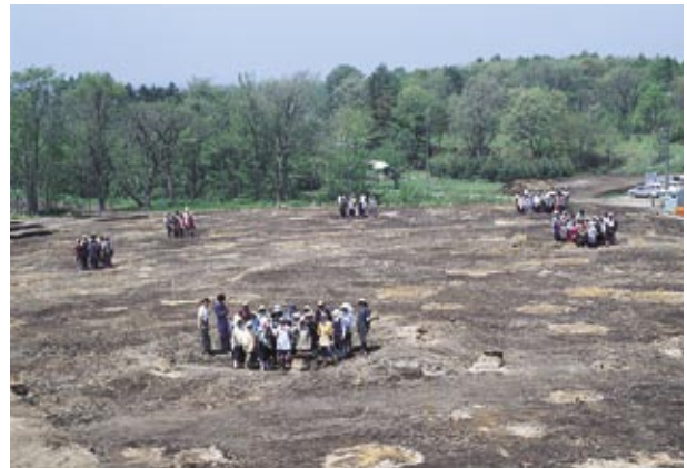
竪穴住居跡調査前写真

遺跡は、キウス川の南側の標高約18mから27mの台地上にあります。縄文時代早期からアイヌ文化期までのさまざまな遺構、遺物がみられますが、主体的にみられるのは擦文時代のものです。特に竪穴住居跡は調査前の地表面から四角い窪みが数カ所で確認されました。これらは平面形が隅丸方形で、炉やかまどを持ち、4本の柱で上屋を支える構造であったようです。住居の覆土や掘り上げ土からは多数の擦文土器のほか、紡錘車や土玉などがみられ、時期は8世紀頃と考えられます。このほか特徴的な遺物として、縄文時代早期の石刃鎌が20点以上出土しています。