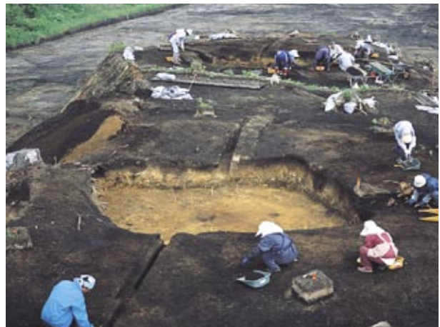
竪穴住居跡掘り上げ土検出状況

写真は、竪穴住居を掘り上げた時に、周囲に盛った土がドーナツ状に広がっている様子です。