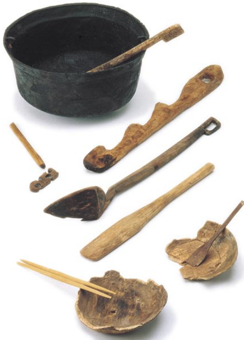
千歳市美々 8遺跡出土品（擦文～アイヌ文化期 重要文化財）

「テエタ」はアイヌ語で“昔”を意味します。北の大地で繰り広げられた昔の人々の文化や環境を、現在と未来の人々に伝えるのが私たちの仕事です。昔のこと、古いことを広く知ってほしいという願いを込めて「テエタ」をこの冊子のタイトルにしました。