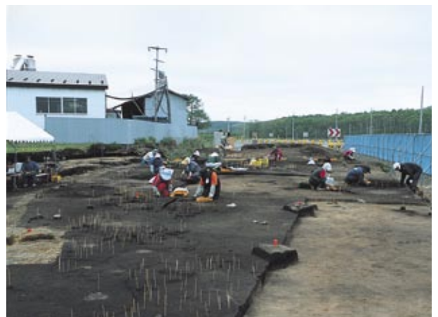
縄文時代の調査状況

今年度の続縄文時代の焼土の中には、焼けた骨が大量に含まれているものがあり、食生活などの復元が期待できます。