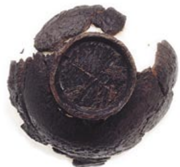
底面に印 (シロシ) のある漆塗椀