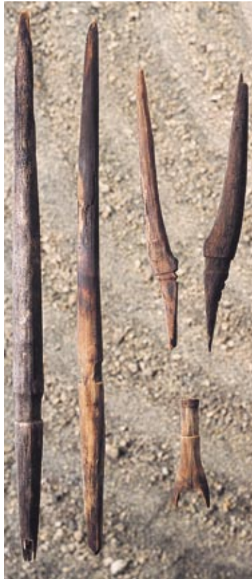
回転式離頭鉈中柄・指掛部