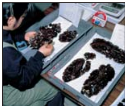
表紙の接合資料 右側のコンテナが表紙の接合資料、さらにそれに左側の手に持っている中身の尖頭器が持ち出された中空の接合資料が接合する

白滝の整理事業では、黒曜石を色や特徴から 5 種類に分け、さらに縞や網目模様などを目安に同じ原石を探していきます。灰色や白色が混じりますが、基本的に黒色のものを「黒曜石 1」、俗に梨肌と呼ばれ、気泡が入り表面がザラザラして光沢が鈍いものを「黒曜石 2」、黒色に茶色が混じるものを「黒曜石 3」、逆に茶色が多く、それに黒色が混じるものを「黒曜石 4」、そして黒色に紫に近い茶色が混じるものを「黒曜石 5」としています。黒曜石は一般的に黒色と思われがちですが、色、つや、模様など様々なものがあり、石器によっては、茶色の石を意識的に選んで作っている場合も見られます。