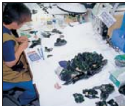
愛称「ゴジラ」の超大型接合資料 (上白滝 8) 長さ 50cm、大型の尖頭器を作っているが、中身がない中空の状態