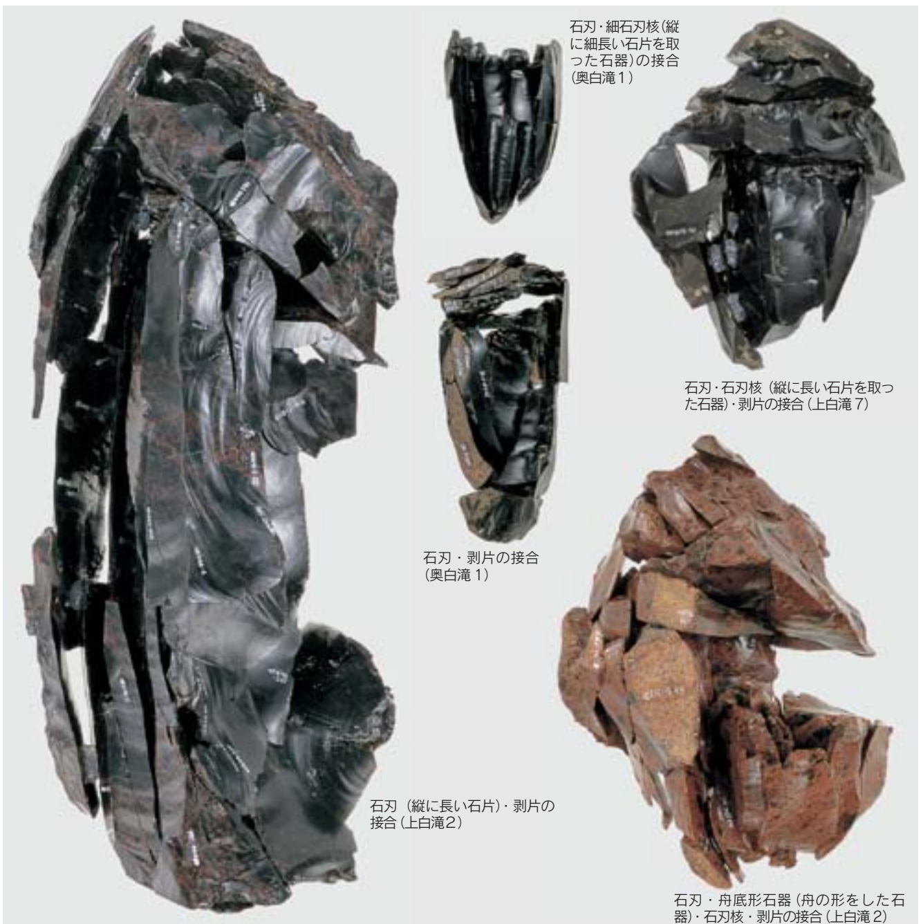
各種の接合資料 (大きさ 1/2)

接合して組み上げたパズルは「接合資料」と呼ばれ、石器を作った人々の技術、考え方、生活、そして行動の様子までも知ることができるのです。どのような大きさ、形の黒曜石の原石を選び、どのようにしてどんな石器を作ったのか。時には試し割をしてから、また、持ち運びやすい大きさに荒割してから遺跡に持ち込み、石器作りを始めているものもあります。また、どこをどのように叩いて素材を取り、石器に加工したか、また、失敗して折れてしまったか、などが分かるのです。白滝での石器作りは、大型の原石が比較的手に入り易いため、ぜいたくに石を使っています。その分、石器作りへのこだわりが随所にみられます。思うような石器が出来上がった場合は、どこかへ運び出されたとみられ、作った時の石片のみが接合した中空の接合資料となっています。鯛焼きに例えると、皮だけでアンコがない状態です。また、途中で折れたり、思うように出来なかったものは、遺跡に残され、時を経て発掘されるのです。