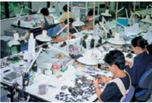
接合作業 各自が担当の石を自分の前に並べる

白滝での石器製作の様子を知るためには、この大小の石片が大事なのです。発見された石器は水洗後、遺跡番号、出土した発掘区、遺物番号を注記し、重量を測り、特徴を観察、つまり名札を付け、身体検査をして接合作業にはいります。ジグソーパズルであれば2次元の平面的なもので、さらに全てのパーツが揃っています。しかし、石器は3次元、上下左右に前後が加わり、また、どの程度の破片が残っているかも不明で、答えが無いに等しいのです。