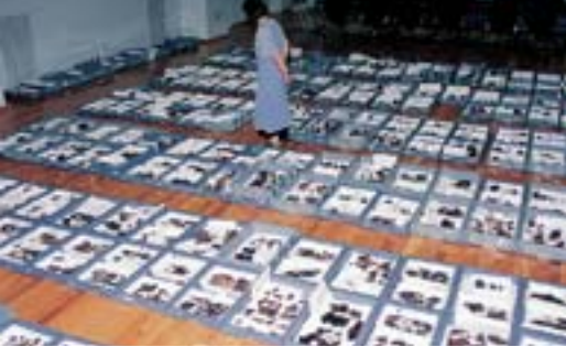
並べられた接合資料 写真撮影準備のために研修室に並べられた上白滝8遺跡の「黒曜石3」と「黒曜石4」の接合資料