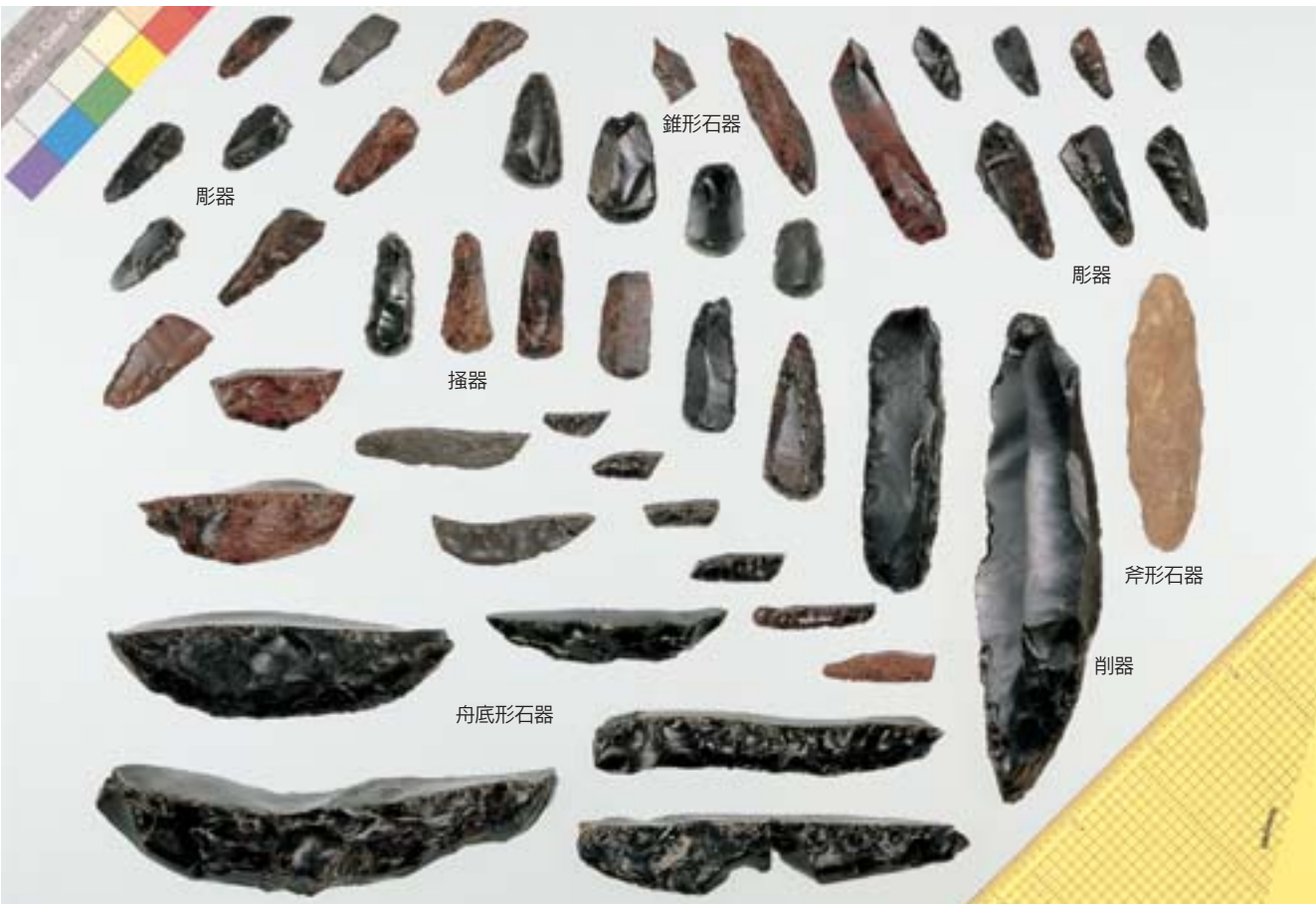
上白滝8遺跡の各種石器