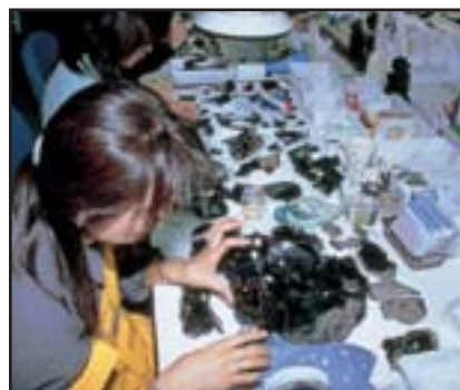
大型原石の接合資料 (上白滝 8) 川原にある大型の原石を遺跡に持ち込み、石器作りが行われている

土器の接合は、現在でも日常的に使用している鍋や食器をイメージして破片を探すことができますが、石器の場合は、石を割ることなど石器作りの様子をイメージすることが困難です。しかし、石の模様、つやなどを頼りに探していくと同じ石が見えてくるもので、1日に1点か2点しか接合できない時もありますが、接合しだすとウソのように次々と塊が組み上がることもしばしばです。現在 25 名ほどの女性スタッフで接合作業を行っていますが、その人たちの細かな観察力と感覚、そしてそれらにわれわれ調査員の考古学的な知識や経験が加えられて接合作業が進んでいきます。おそらく数百万点の石器を相手にして接合作業を行っていることも、そしてこれだけのスタッフで石器接合を進めていることもわが国ははじめ世界でも類をみないのではないかと考えています。