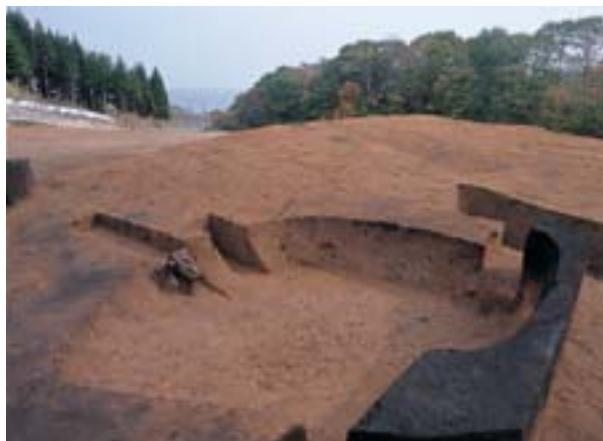
土壌 P-3 遺構調査状況

土器の時期は縄文時代中期から後期前葉が主です。石器はスクレイパーやすり石などが出土しています。